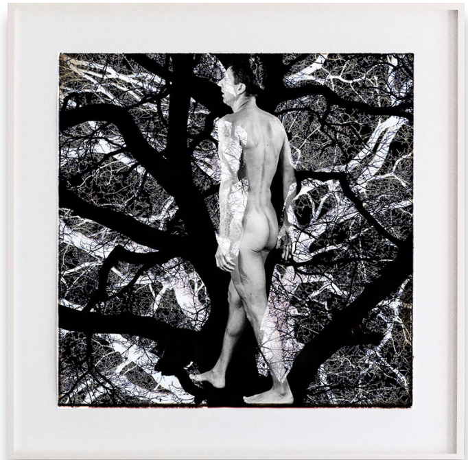
gedankengang // line of thought 2019-0003

64×64 cm – 25,2×25,2 inch // fine art print // edition of 8 (gerahmt 80x80cm – 31,5×31,5 inch)